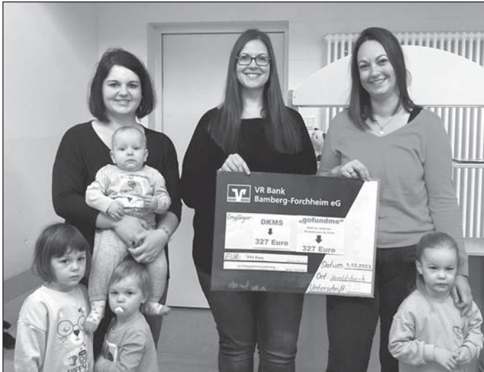
Der Elternbeirat und das Team des Kinderhauses St. Michael